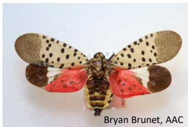
Bryan Brunet, AAC

Insectes à surveiller et à signaler par toute personne qui surveille, photographie et observe les insectes. Utilisez le code QR pour signaler toutes les observations, y compris les espèces réglementées par l'Agence canadienne d'inspection des aliments (ACIA) .